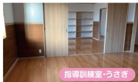
指導訓練室・うさぎ