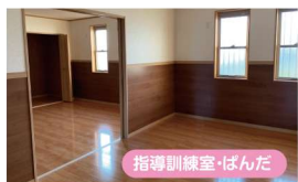
指導訓練室・ばんだ