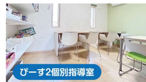
ぴーす2個別指導室